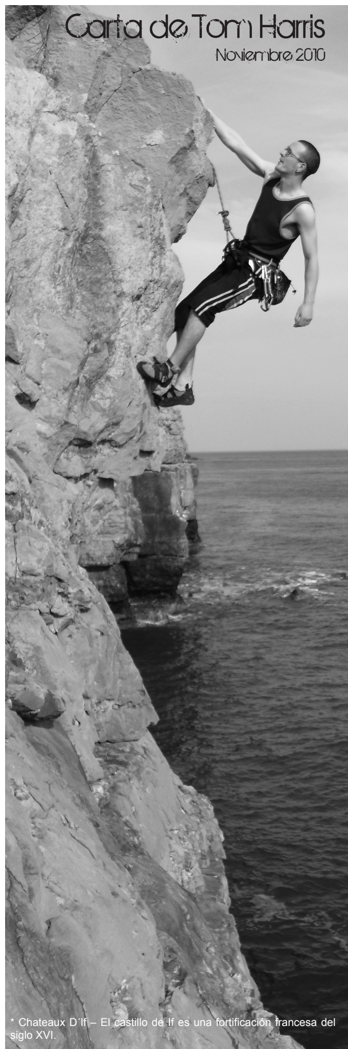
* Chateaux D'If – El castillo de If es una fortificación francesa del siglo XVI.